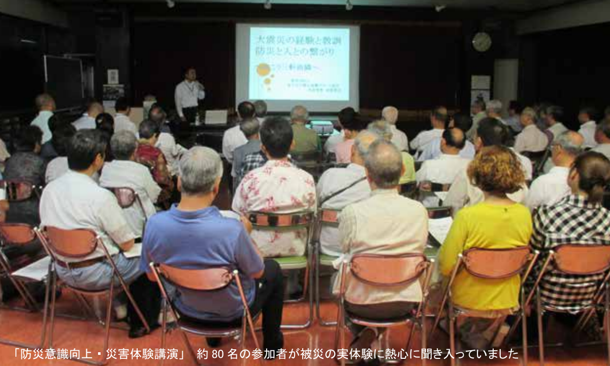
「防災意識向上・災害体験講演」 約80名の参加者が被災の実体験に熱心に聞き入っていました