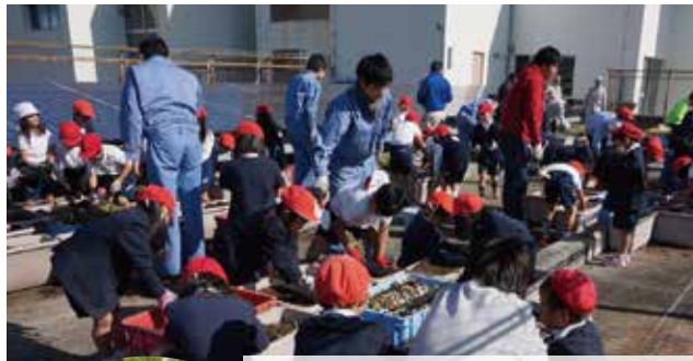
上：西野田工科高校のお兄さんお姉さんから芋掘について学ぶ大開小学校の児童達

校舎の屋上でサツマイモを水耕栽培し、大開小学校児童を招待して芋ほり、大開小学校校庭でのビオトープの製作、阪神電車の高架下の商店と連携して店舗のシャツターへ描画、生徒が製作したちりとりを使って地域の清掃活動に参加する等、地域の人に喜ばれています。