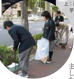
左：お手製のちりとりで地域清掃に参加する西野田工科高校の学生達